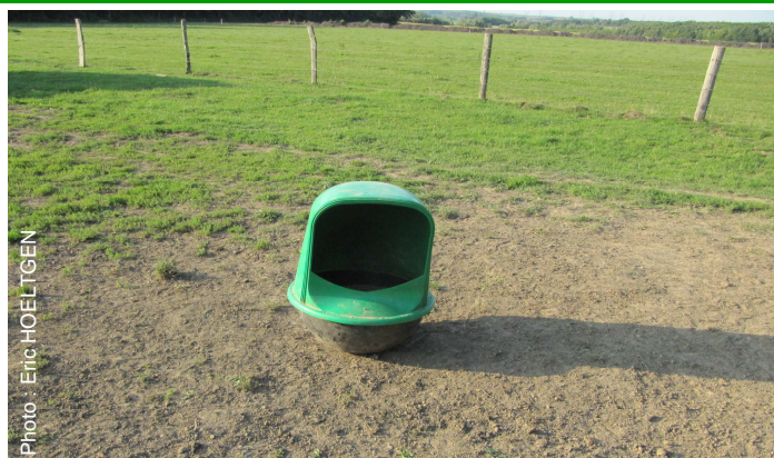
Minéral en libre service au pré