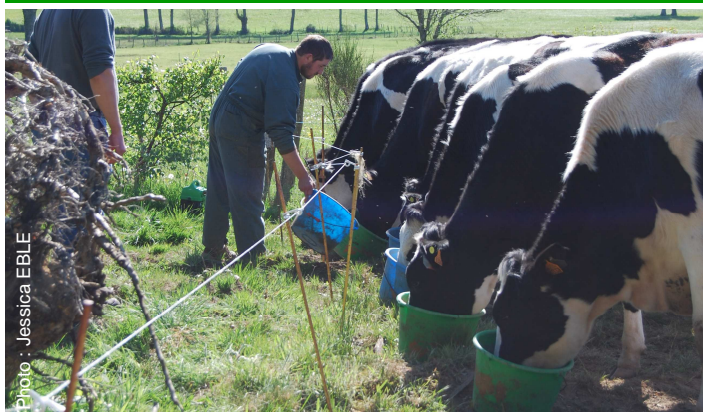
Apport quotidien de minéral même au pré